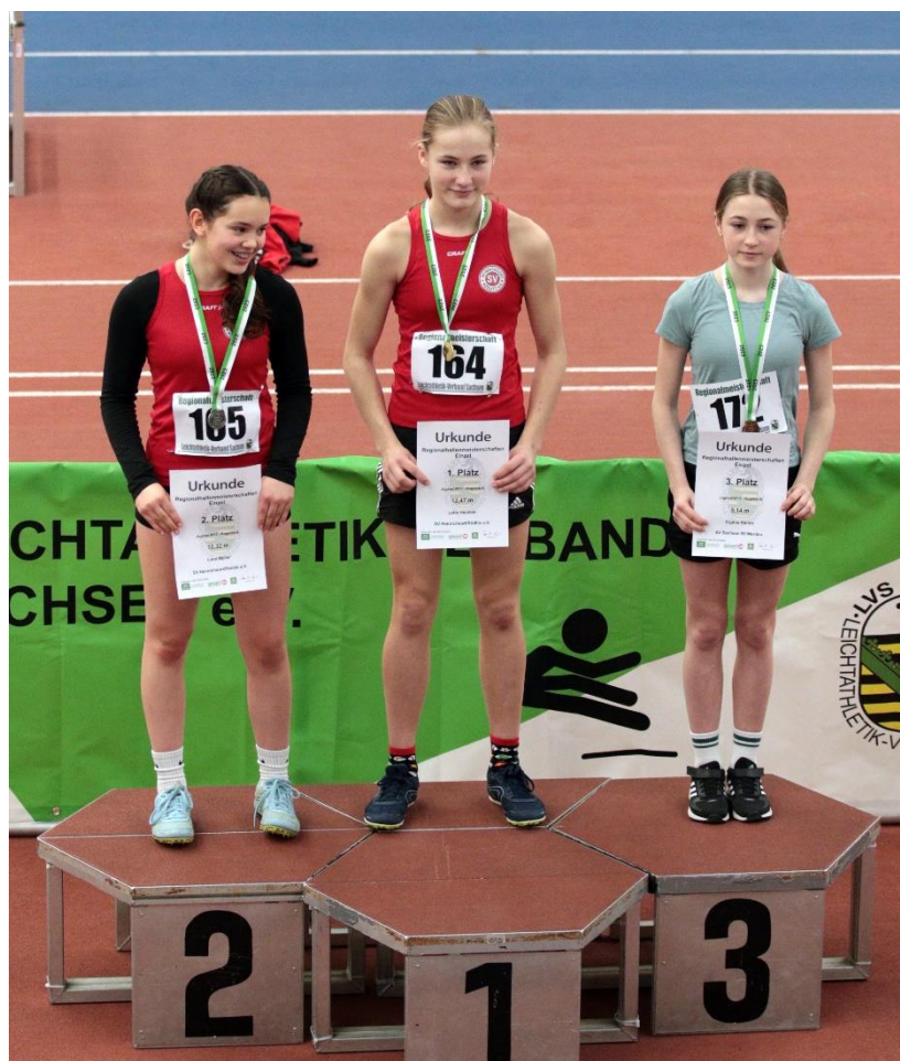
Siegerehrung im Kugelstoß W13.