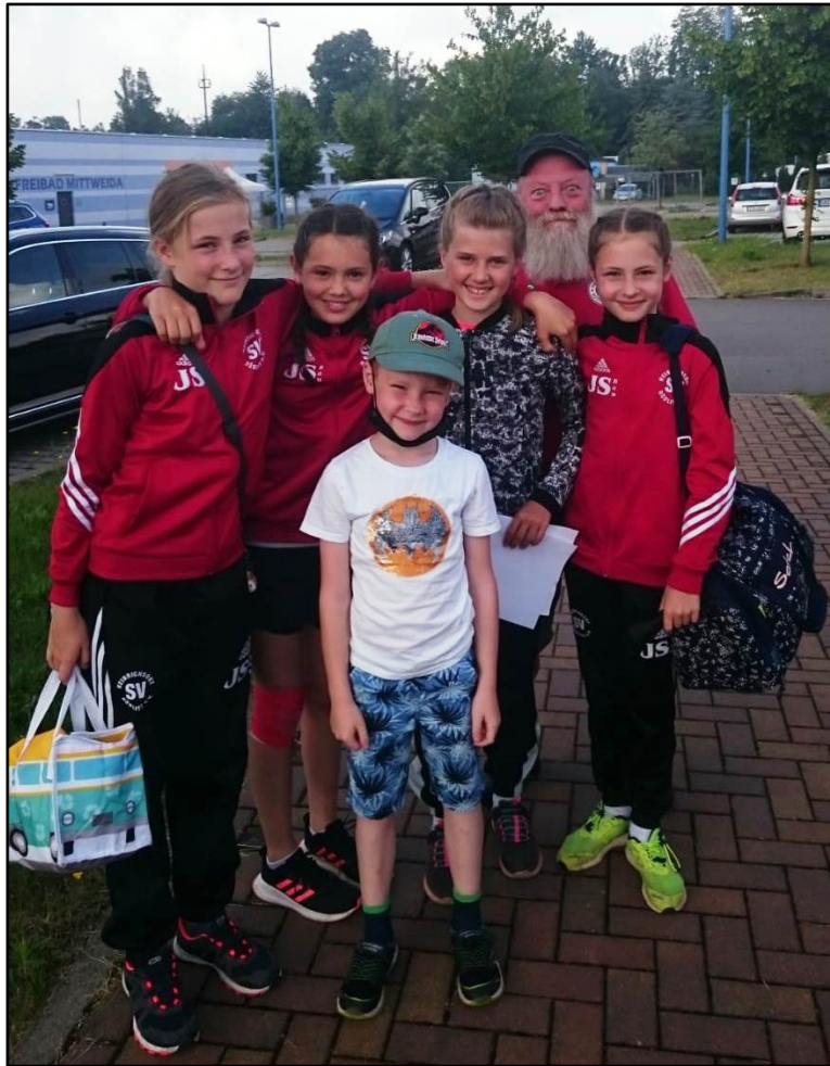
Ankunft in Mittweida.